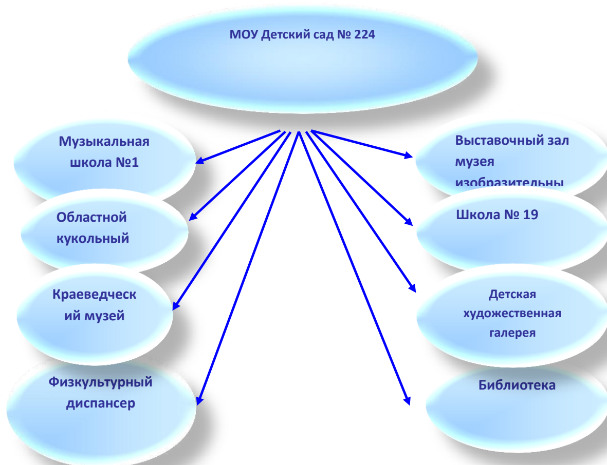
Схема внешних взаимосвязей МОУ детского сада №224